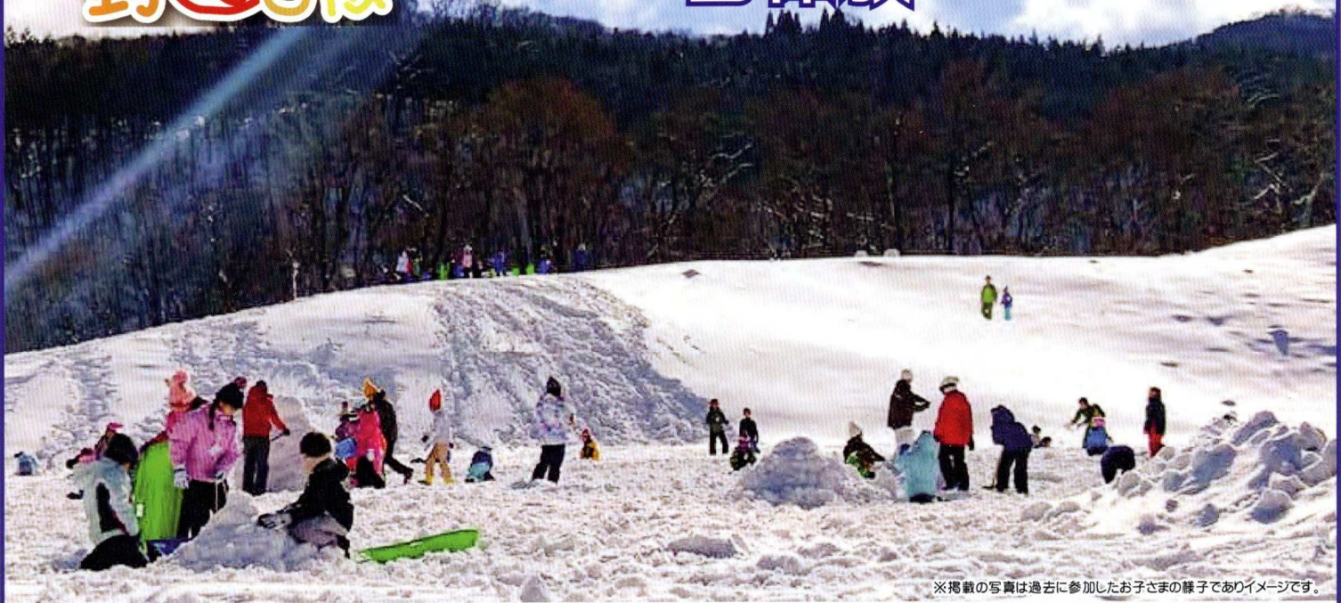
※掲載の写真は過去に参加したお子さまの様子でありイメージです。

◎ 旅行の内容 ※障がいやアレルギーなどについては、NPO法人おやこのびっこ安城までご相談ください。